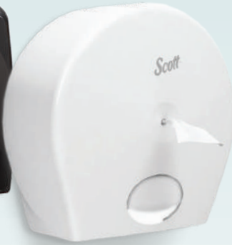
7046 Scott® Center Pull Bath Tissue Dispenser กล่องบรรจุกระดาษชำระ ม้วนใหญ่ แบบดึงตรงกลาง